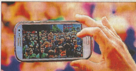
Unzählige Handy-Kameras kamen am Donnerstag beim großen Kinderchor-Konzert zum Einsatz.

→ NWZ-TV zeigt einen Beitrag unter www.NWZ.tv/wesermarsch