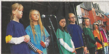
Die Mädchen der Südschule machten einen tollen Job als Vorsängerinnen.