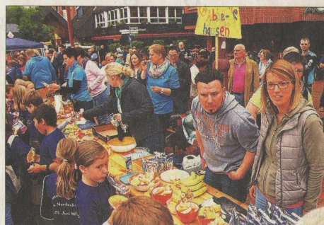
Nach dem Konzert konnten sich die Schüler auf dem Marktplatz mit Frühstück versorgen.