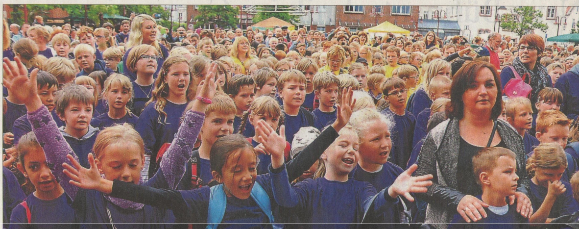
Begeistert und gut gelaunt: Die Schüler hatten mächtig Spaß bei ihrem Konzert.

SCHULE 1000 Jungen und Mädchen singen auf Marktplatz – Prima Stimmung – Ärger wegen Strafzetteln